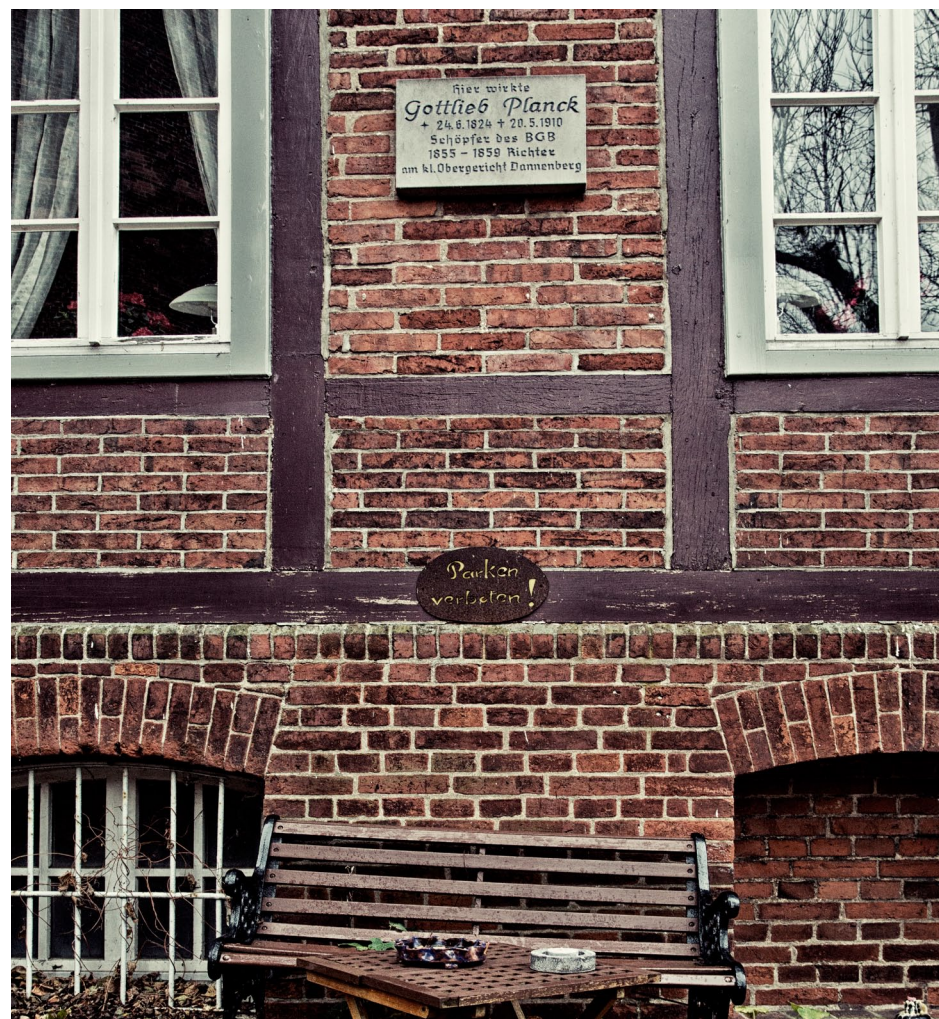
Gedenktafel für Gottlieb Planck: Richter und Rebell. In Aurich hatte Planck in einem Urteil die Außerkraftsetzung der liberalen Verfassung aufgehoben, wurde daraufhin von 1855 bis 1859 nach Dannenberg ans „kleine Obergericht“ strafversetzt. Er war der Onkel des Physikers Max Planck und wurde als Mitverfasser des Bürgerlichen Gesetzbuchs bekannt