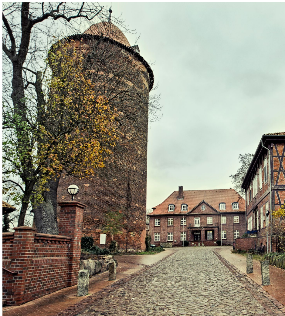
Ein holpriges Kopfsteinpflaster führt hinauf zum Amtsgericht vorbei am Waldemarturm, in dem der Dänenkönig Waldemar II. von 1224 bis 1225 gefangen gehalten wurde. Rechts gegenüber der Dannenberger „Jugendknast“, einst Sitz des „kleinen Obergerichts“

cen hatten“, sagt Grote. „Aber jemanden zu hart zu bestrafen, etwa mit Jugendknast, hilft angesichts der Rückfallquoten keinem. Andererseits muss das Strafmaß beziehungsweise die Erziehungsmaßnahme spürbar für den Angeklagten ausfallen, in der Hoffnung, dass er nicht zum Wiederholungstäter wird.“