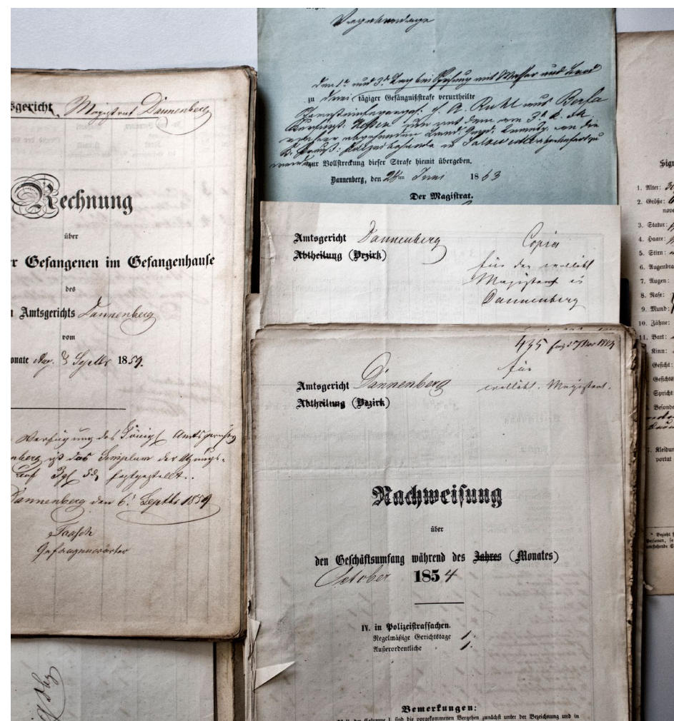
Im Dannenberger Stadtarchiv lagern noch viele alte Dokumente, die Aufschluss geben über die Justizgeschichte des Landkreises, eine Zeit, in der die Verurteilten noch am Schandpfahl büßen mussten