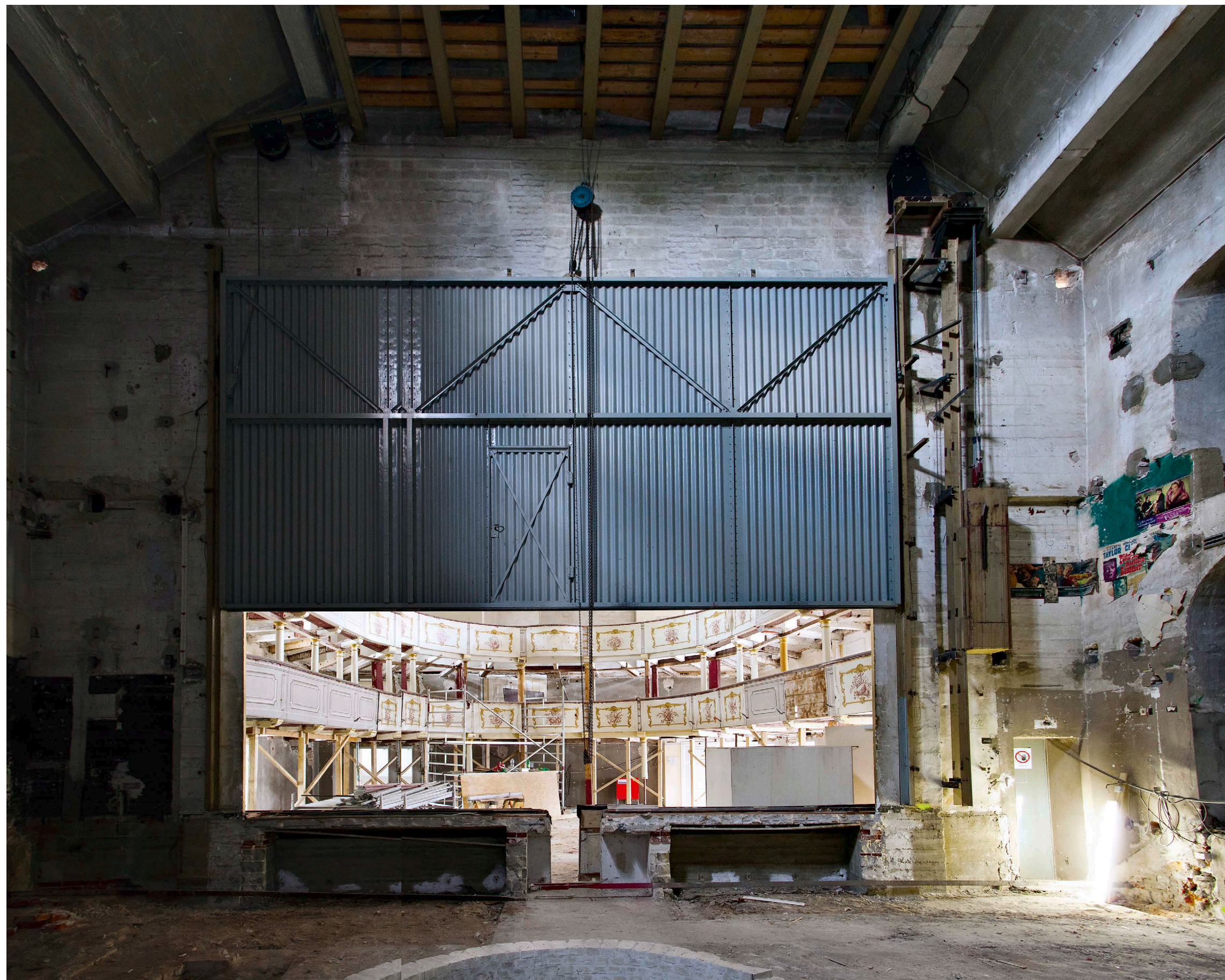
Technisches Wunderwerk: Blick von der Bühne auf den Zuschauerraum während des Umbaus. Niemand muss mehr von Hand den Vorhang ziehen und eine Drehbühne bringt die Darsteller ohne eigenes Zutun ins Rotieren

77 Jetzt gibt es eine moderne Belüftungsanlage, die in den Wandteilen versteckt wurde und die subtropischen Bedingungen während der Aufführungen lindert