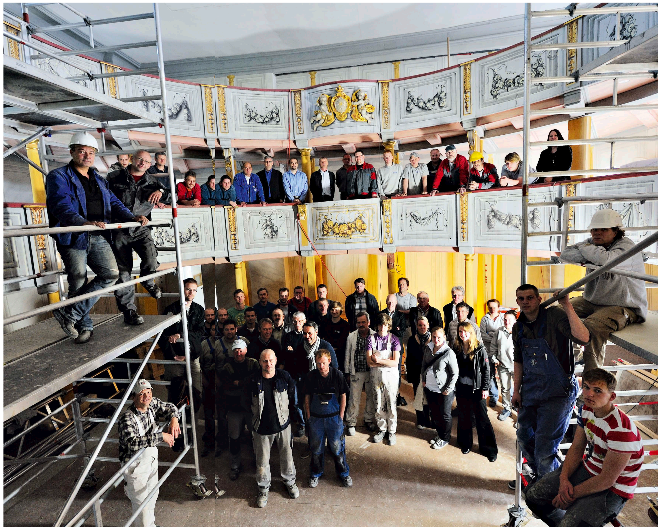
Aufwendige Totalrenovierung: Handwerker und Planer posieren fürs Gruppenfoto im Theaterraum. Rund 45 Firmen waren an der zweijährigen Sanierung beteiligt, die knapp 13 Millionen Euro verschlang

77 Mit dem Mittelgang hatte das Atmosphäre. Jetzt muss man sich von links oder rechts durch- quälen. Und der rote Plüsch strahlte mehr Wärme aus