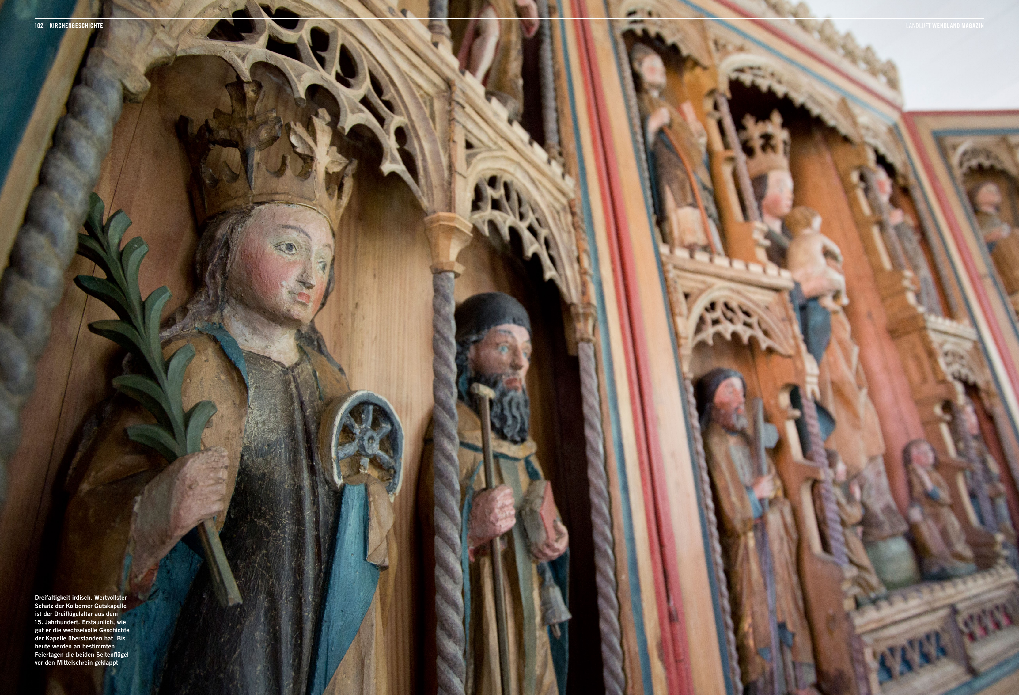
Dreifaltigkeit irdisch. Wertvollster Schatz der Kolborner Gutskapelle ist der Dreiflügelaltar aus dem 15. Jahrhundert. Erstaunlich, wie gut er die wechselvolle Geschichte der Kapelle überstanden hat. Bis heute werden an bestimmten Feiertagen die beiden Seitenflügel vor den Mittelschrein geklappt