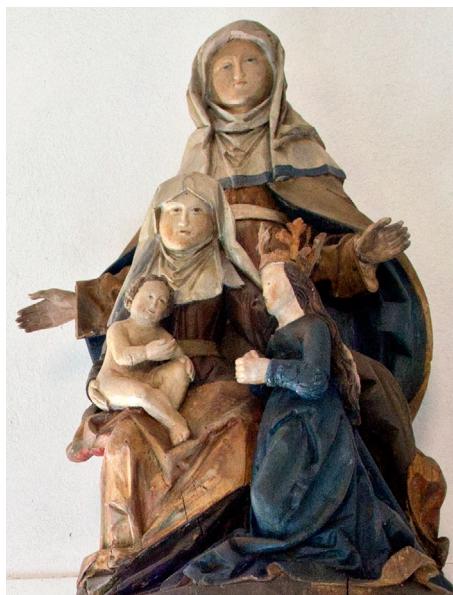
Fromme Raritäten. Das Triumphkreuz der Plater Kirche – mit dem Gekreuzigten und Maria und Josef als Seitenfiguren – wurde 1450 geschnitzt. Die bilderfeindliche Reformation verbannte es auf den Kirchenboden, wo es erst 1900 entdeckt und an alter Stelle wieder aufgerichtet wurde (rechts). Das Sippenbild der Familie Jesu „Anna Selbviert“, um 1500, ist eine sehr seltene Figur im katholischen Skulpturensortiment (oben)

77 Papst Sixtus IV., der die Sixtinische Kapelle in der Peterskirche errichten ließ, erteilte der winzigen Knesebeck'schen Gutskapelle in Kolborn 1479 seinen Segen