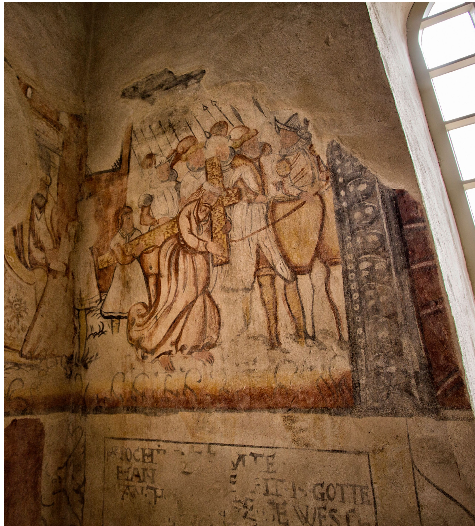
Die Bibel an der Wand. Da viele Bauern jener Zeit nicht lesen konnten, hatte man ihnen die biblischen Geschichten auf die Wände gemalt. Die Zeichnungen der Holtorfer Kirche stammen aus dem 16. Jahrhundert

Nicht alle hatten freilich das Glück der von Platos, mit einer Heiligenlegende dienen zu können und damit zahlungskräftige Pilger